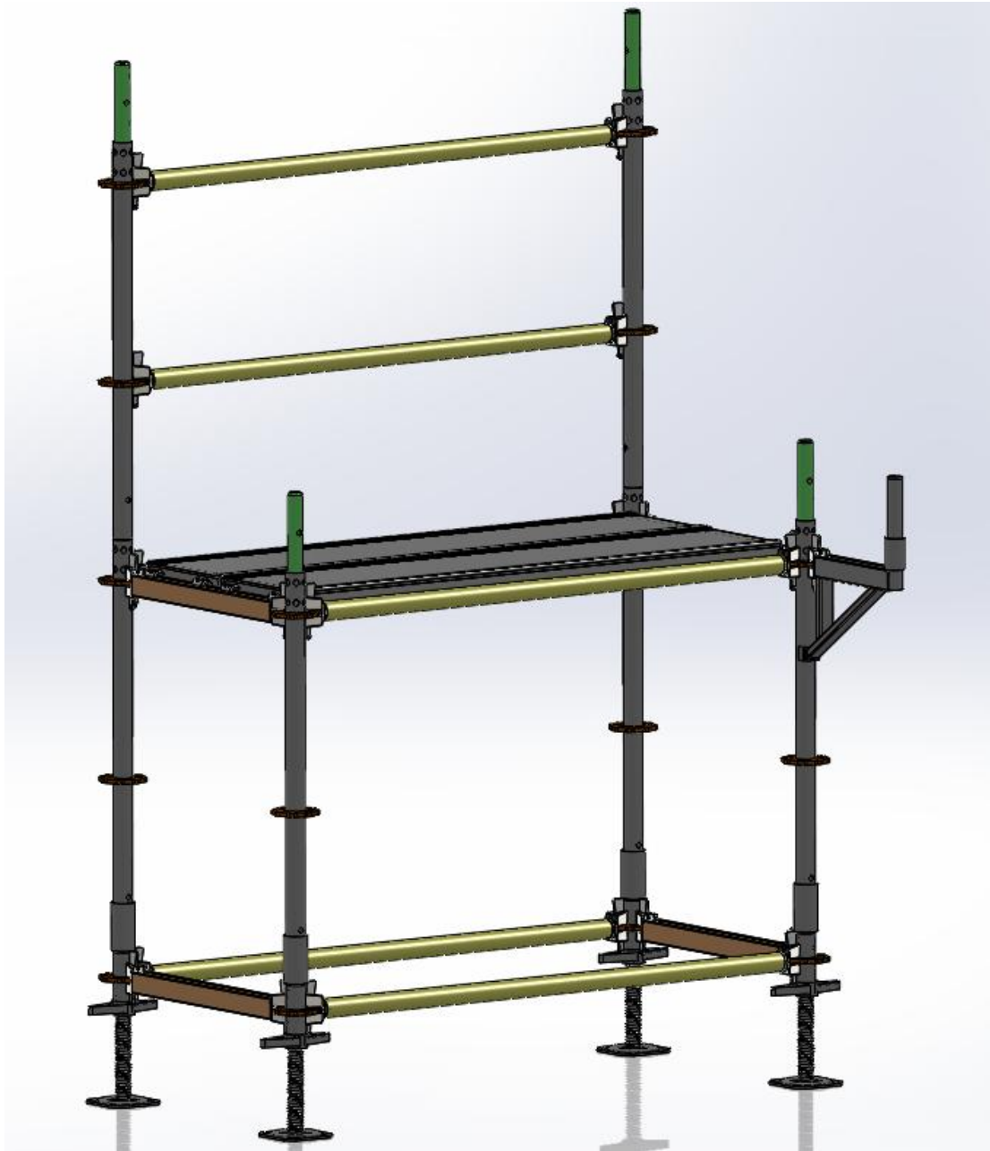
Rys. 2. Stanowisko demonstracyjne – rusztowanie modułowe